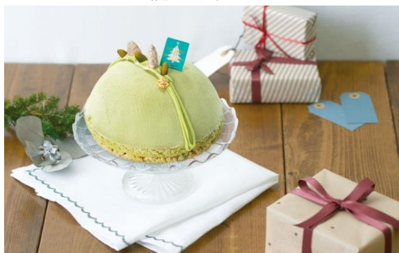
◇パティスリー キハチ 《限定30個》 ピスターシュロウ 3,456円(税込)