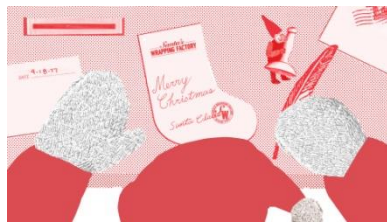
<ムービーイメージ>