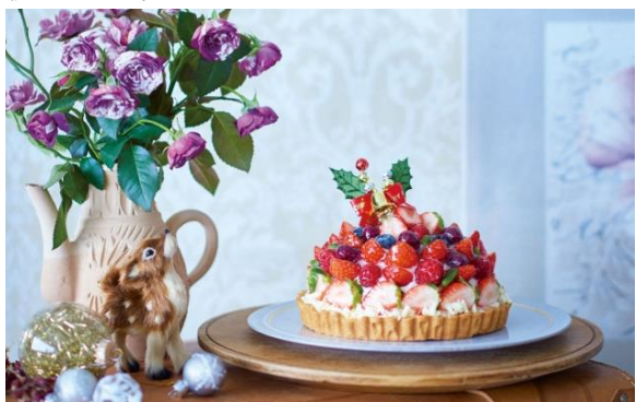
◇デリスデュパレ 《アトレ恵比寿限定》 イチゴのクリスマスタルト 3,888円(税込)

ふんわり軽やかなスポンジに口どけの良い生クリームといちごがたっぷりのったホリデー限定ケーキ