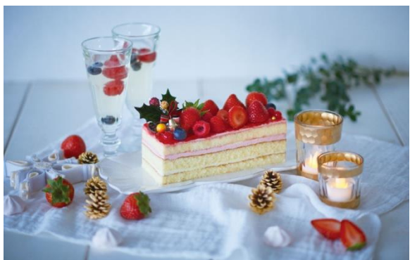
◇千疋屋 《アトレ恵比寿限定80個》 赤いオペラ 4,320円(税込)