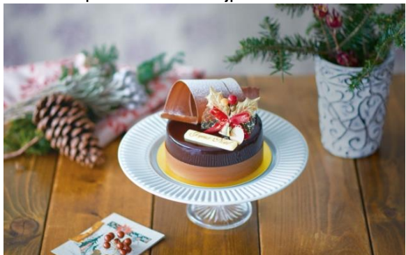
◇ル・グルニエ・ア・パン 《アトレ恵比寿限定30個》 デリスショコラ 3,780円(税込)

URL : http://www.atre.co.jp/ebook/ebisu/201611_01/pageview/pageview.html#page_num=1