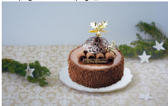
◇アンテノール 《数量限定》 ガナッシュショコラ・ノエル(直径約15cm) 4,212円(税込)