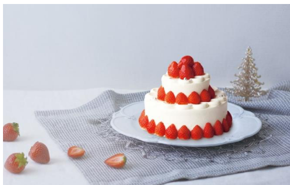
◇ディーン&デルーカ 《限定10個》 ストロベリーショートケーキ 7,560円(税込)

ふんわり軽やかなスポンジに口どけの良い生クリームといちごがたっぷりのったホリデー限定ケーキ