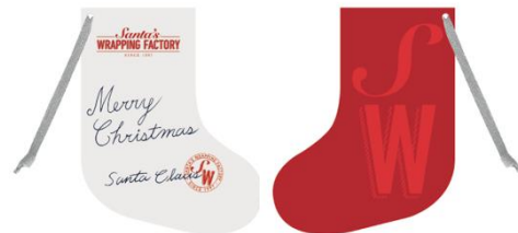
<メッセージカードイメージ>